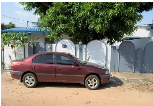
Siège de abitech solution