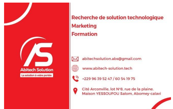
Notre carte web